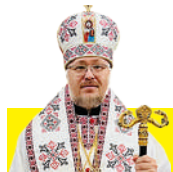
Владика Сергій (ГОРОБЦОВ), митрополит Донецький і Маріупольський:

– Ми стали сім'єю, я не уявляю свого життя без «гуманітарних» жартів,