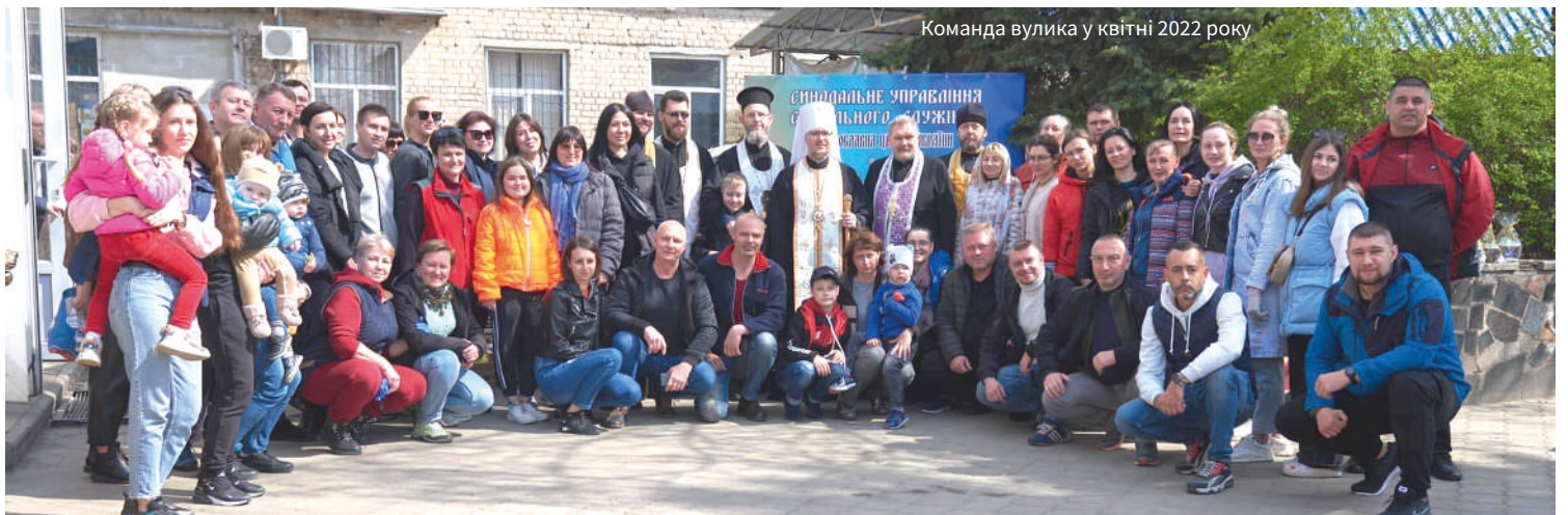
Команда вулика у квітні 2022 року

– Вражає, що наші волонтери понад рік присвячують себе допомозі іншим. Шестеро з них реєструють людей – ми направили велику базу, куди занесені понад 300 тисяч ВПО, яким ми вже надали допомогу. Інші пакують продукти для наборів: щодня нам треба сформувати 200-300 пакунків. Коли приходить гуманітарка – ми її розвантажуюмо. Коли