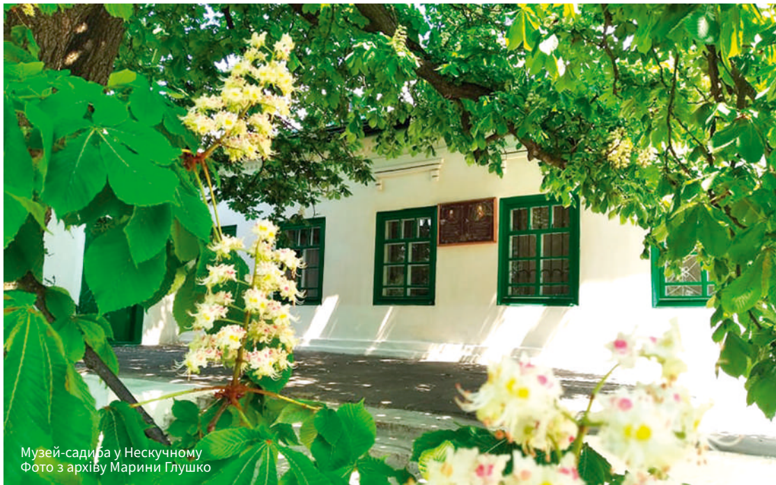
Музей-садиба у Нескучному.

доеднавши до назви ім'я наступного власника садиби – кінематографіста Немировича-Данченка.