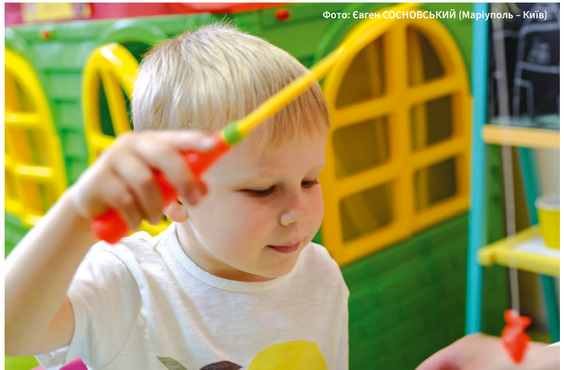
Фото: Євген СОСНОВСЬКИЙ (Маріуполь – Київ)