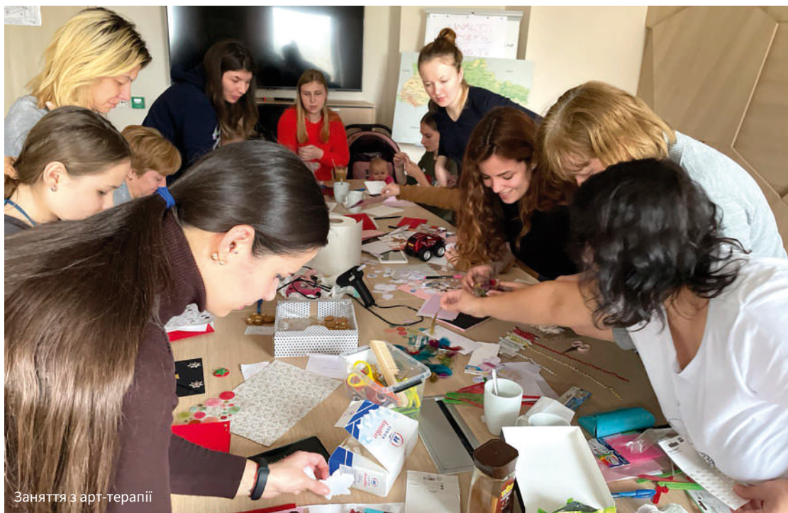
Заняття з арт-терапії

– Восьмий клас – останній у польській школі. Син вже двічі складав пробні іспити й показав результати, не гірші за місцевих учнів. Наші українські діти забезпечені у школі всім необхідним, батькам не потрібно нічого купувати. Українські школярі мають таке ж право на пільговий проїзд, як і польські.