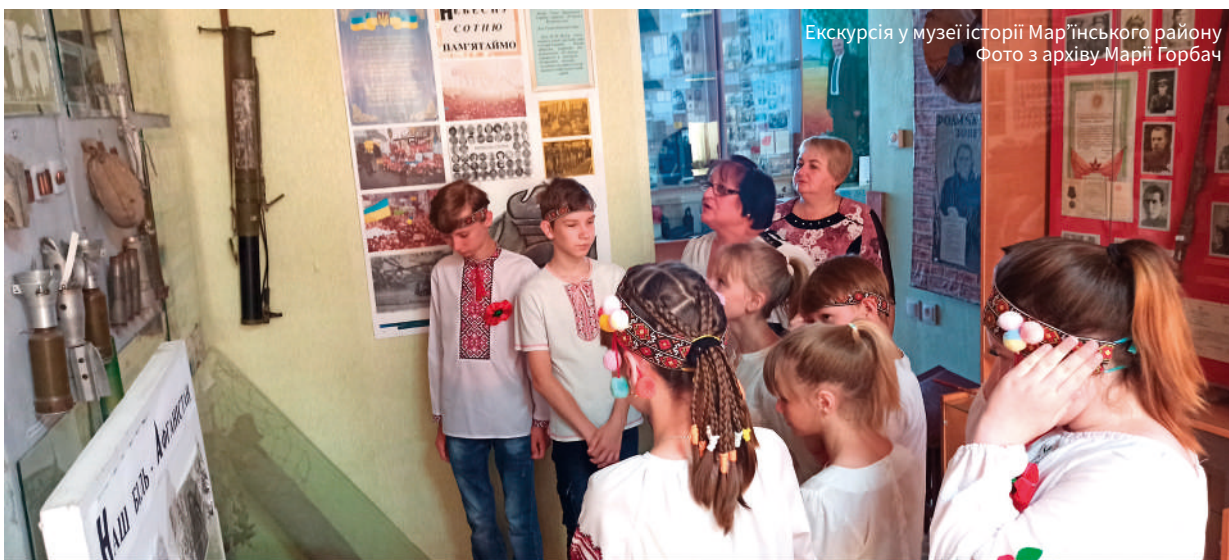
Екскурсія у музеї історії Мар'їнського району.

Цікавим було і саме приміщення музею. Колись тут знаходилася земська школа, а у часи Другої світової війни працював шпиталь, який німці спалили, коли відступали.