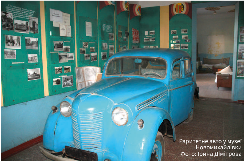
Раритетне авто у музеї Новомихайлівки