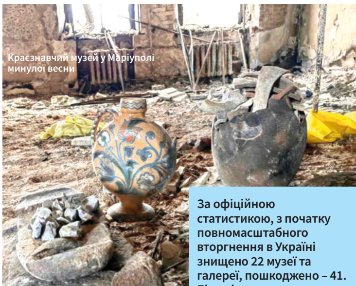
Краєзнавчий музей у Маріуполі минулої весни