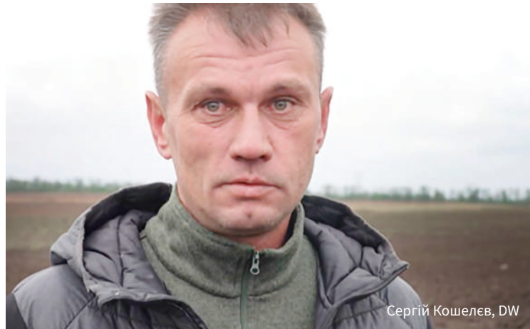
Сергій Кошелєв, DW

Соняшник, до речі, – найбільш масова культура, яку нині садять на Донеччині. Посівна загальмувалася дощами, але у травні у Черкаській та Новодонецькій громадах Краматорського району, а також у Мирноградській та Покровській громадах Покровського району сівбу було завершено. Звісно, в обсягах, набагато менших, ніж раніше.