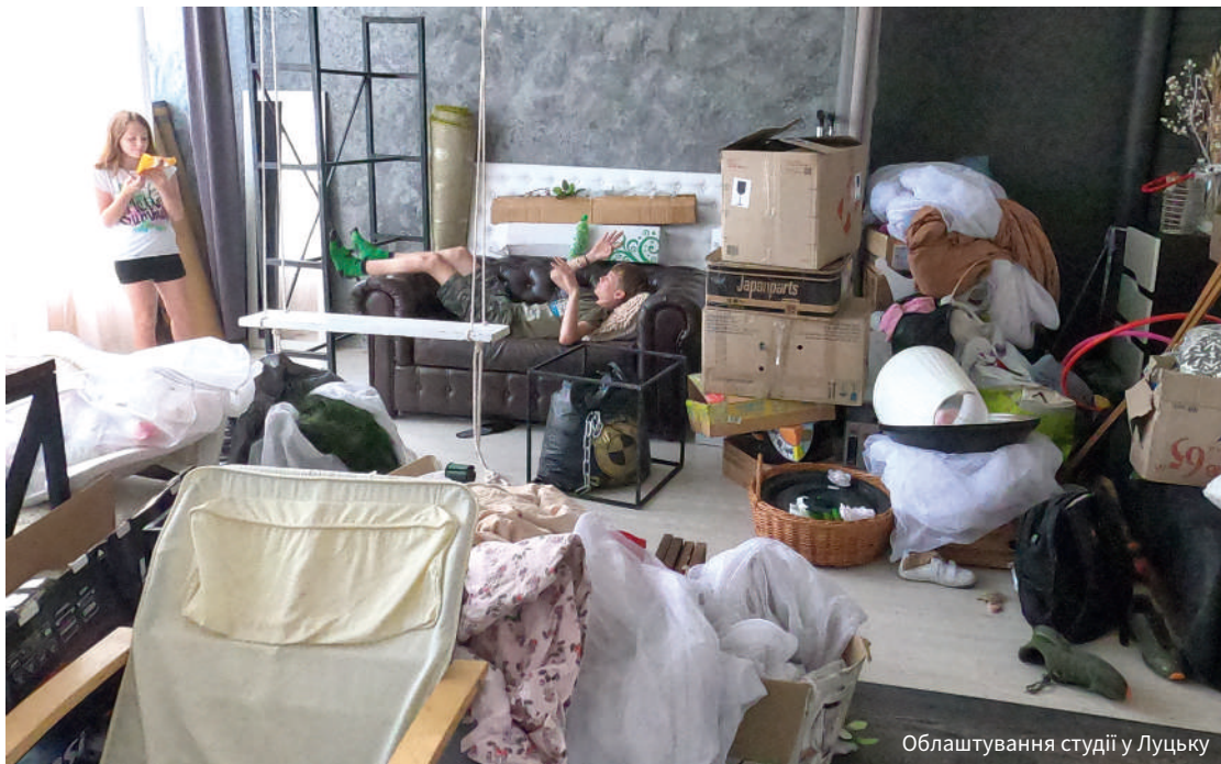
Облаштування студії у Луцьку

У селі на Волині прожили недовго. Ланкіни скористувалися програмою державної підтримки релокації бізнесу і подали заяву на перевезення обладнання студії. Затримка вийшла із відправкою вантажу до Краматорська – 8 квітня ро-