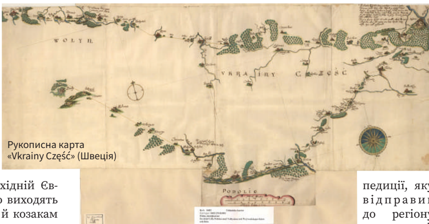
Рукописна карта «Vkrainy Czeszc» (Швеція)

Князь Миколай Криштоф Радзивілл. У її розробці брали участь князь Костянтин-Василь Острозький, математик Якуб Босгрейв та низка вчених Острозької школи, яка