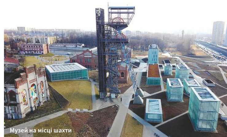
Музей на місці шахти

Щоправда, від концепції зведення міст-супутників швидко відмовилися, а житлове будівництво було зосереджене на заповненні лакун у існуючій місь-