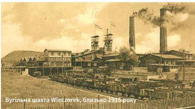
Вугільна шахта Wieszorek, близько 1915 року

тільки із Катовіцького воеводства до Німеччини емігрувало близько 63 тисяч німців, а у 1970-х цей показник становив уже 137 тисяч. Процес виїзду тривав практично упродовж