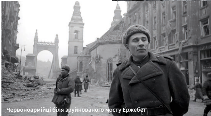
Червоноармійці біля зруйнованого мосту Ержебет

Найбільше зазнав втрат центр угорської столиці – з 782 будинків уціліло загалом 5%. Було знищено 26% громадських будівель й майже 100% промислових об'єктів. Не вцілів жоден із семи мостів через Дунай, найбільше дісталось мосту Ержебет, який був підірваний частинами Вермахту під час відступу. Тож, у перші повоєнні роки нагальним питанням, окрім відновлення житлового фонду, була реконструкція транспортних артерій.