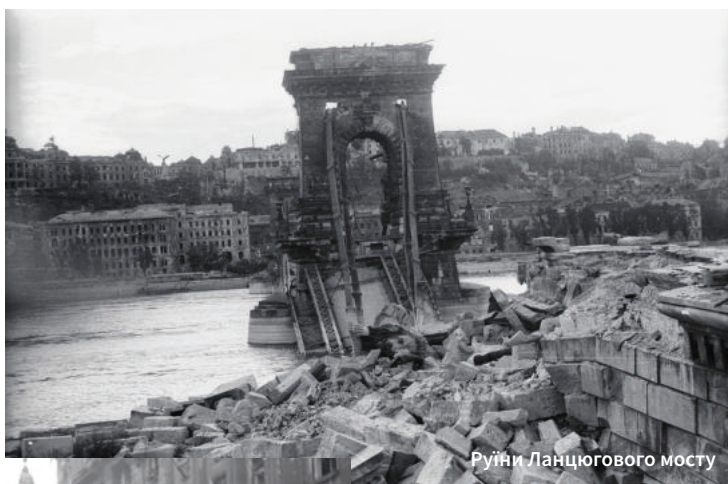
Руїни Ланцюгового мосту

Масштаби руйнувань Будапешта можна порівняти хіба що з Варшавою. Тут, на Дунаї, як і на Віслі, нищення було тотальним: до третини житлових будинків Будапешта було знищено або сильно пошкоджено. Унаслідок облоги та бомбардувань близько 36 тисяч сімей у місті залишилися без даху над головою. Сукупні втрати, враховуючи жертви Голокосту та депортацію угорців радянськими військами, становили майже 100 000 осіб.