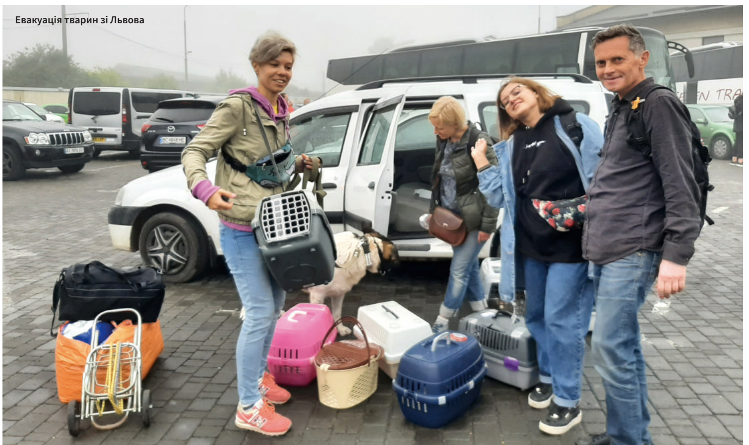
Евакуація тварин зі Львова

– З 24 лютого десь до 5 березня ми переховувалися у власному будинку. Ми жили в сталінці на першому поверсі, під яким було капітальне бомбосховище із запасним виходом. Його робили на випадок ядерної війни. Напередодні дня, коли Маріуполь повністю залишився без зв'язку, я встиг відправити рідним sms – усього чотири коротких речення, де прощався і просив молитися за нас. Я написав донькам: