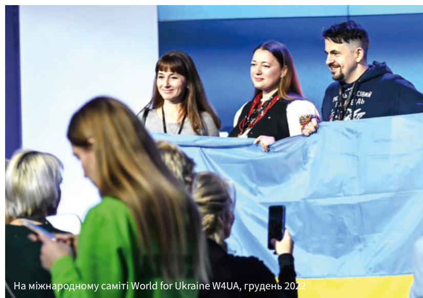
На міжнародному саміті World for Ukraine W4UA, грудень 2022

хоче просто анонімно заповнити анкету. Але просто щоб поділитися з кимось своїм болем, люди погоджуються розповісти те, що бачили і пережили самі. І