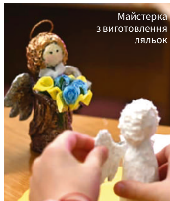
Майстерка з виготовлення ляльок

Директорка бібліотеки каже, що тоді сітки плели в усіх залах. У «найгарячіші» дні поверх, де розташований волонтерський центр, був повний народу – щонайменш 300 людей, зазвичай більше. Наразі залишилися найвідданіші волонтери, які є учас-