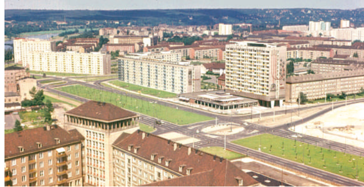
Дрезден соціалістичний, 1972 р.

об'єднання Німеччини, закінчилася аж 2005 року, а відбувалася за рахунок добровільних пожертв. Сучасний собор виглядає так само, як і до бомбардування, але зі строкатими вставками обгорілого каміння, збереженого з його руїн.