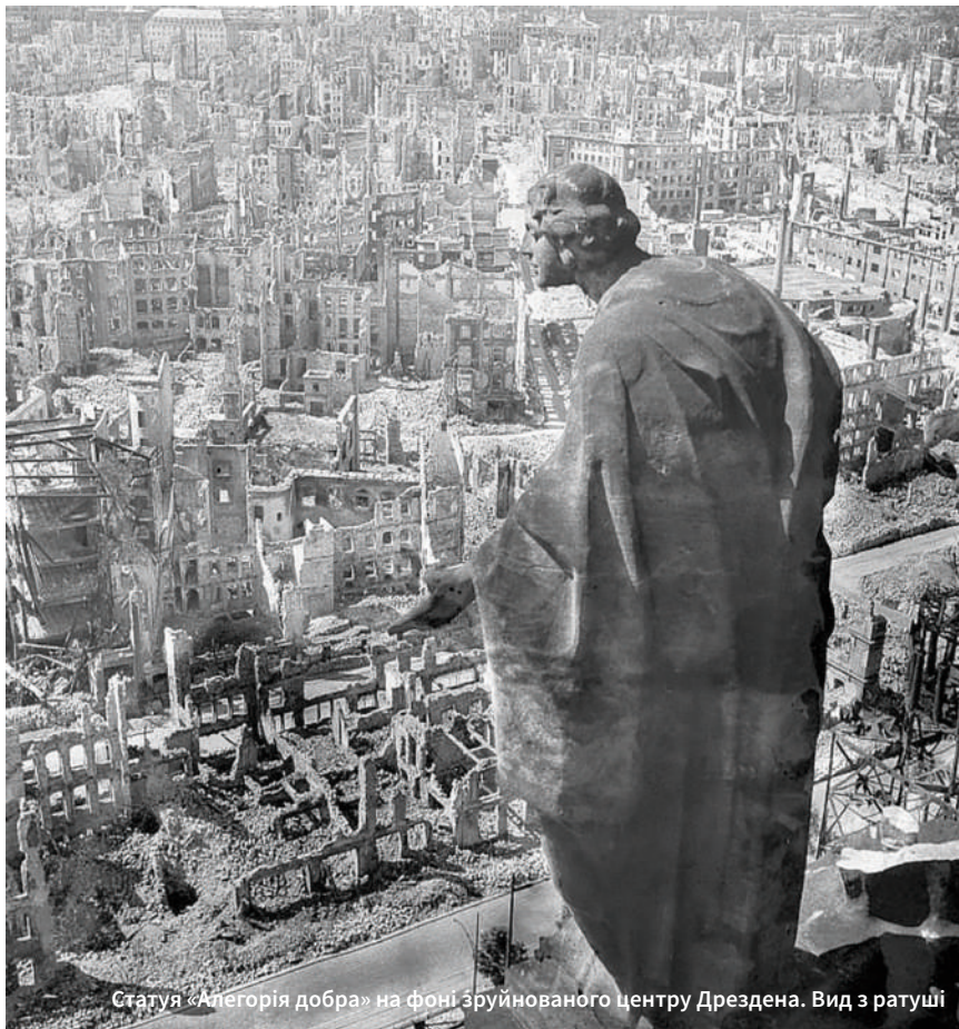
Статуя «Алегорія добра» на фоні зруйнованого центру Дрездена. Вид з ратуші

13-15 лютого 1945 року 1300 літаків союзників скинули на місто запальні бомби загальною масою 4 000 тонн. Це були години пекла на землі, коли полум'я засмоктувало повітря з такою силою, що виникав ураганний вітер, і хто не загинув під руїнами, той згорав живцем чи задихався в укриттях від отруйних випарів.