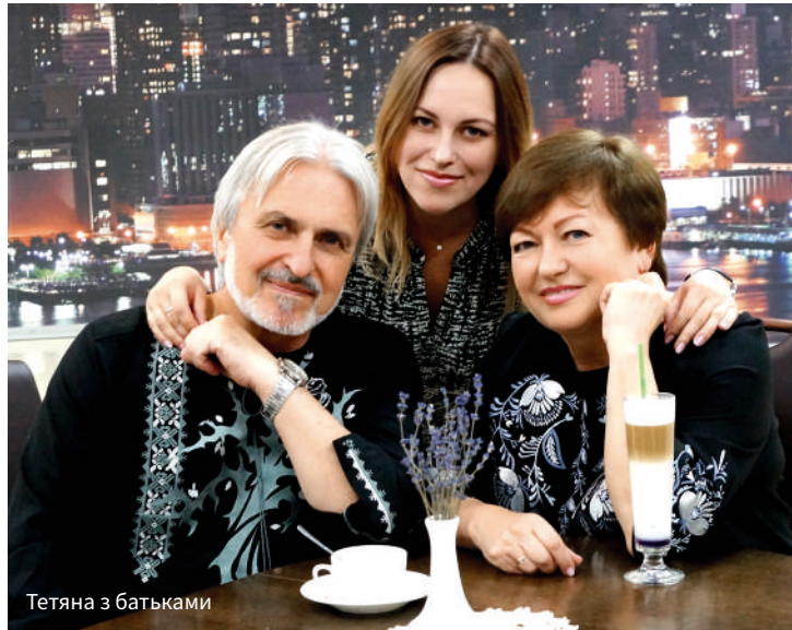
Тетяна з батьками

з деревом життя всередині. Коли цей образ склався, далі пішло швидше. Існує думка, що комп'ютерна вишивка – річ проста. Мовляв, картинку загрузив, кнопку натиснув – і машина все сама робить. Це зовсім не так, це робота, що займає певний час та вима-