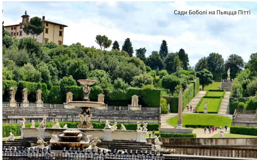
Сади Боболі на Пьяцца Пітті

А повертати було що. Сам Хартт говорив про це так: «Поза всяким сумнівом, твори мистецтва, викрадені з Італії, є найвагомішими з тих, що за час окупації німці вилучали з будь-якої іншої окупованої країни або, якщо на те пішло, з усіх інших окупованих країн разом узятих».