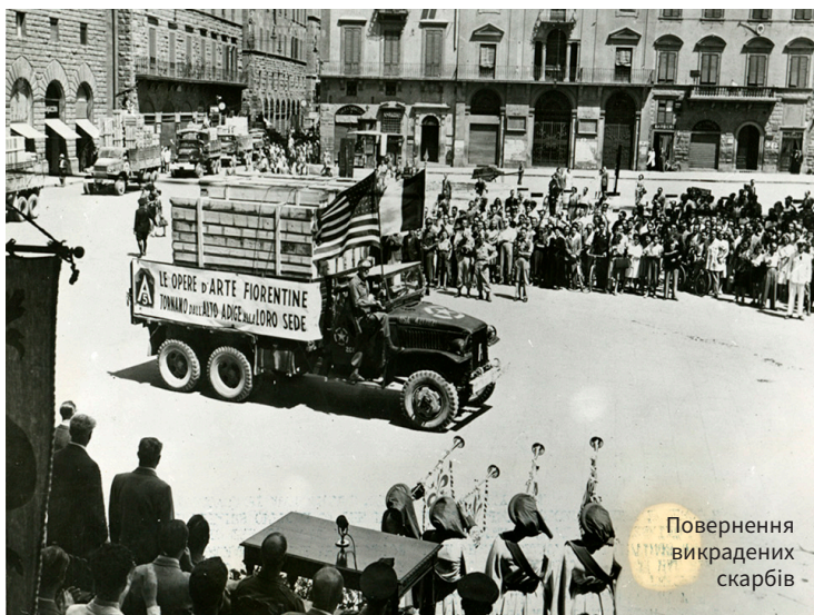
Повернення викрадених скарбів

Цікаво, що 2021 року у Флоренції встановили перший в