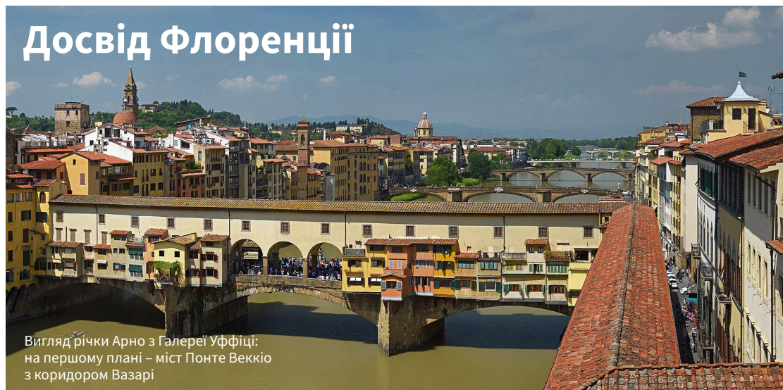
Вигляд річки Арно з Галереї Уффіці: на першому плані – міст Понте Веккіо з коридором Вазарі

Про це свідчить меморіальна табличка на стіні врятованого моста. 1955 року Герхард Вольфа було удостоєно звання почесного громадянина Флоренції.