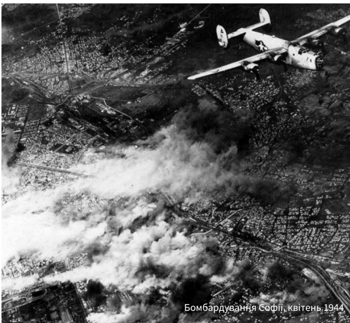
Бомбардування Софії, квітень 1944

Створенням Народного парку на горі Вітоше розпочалася