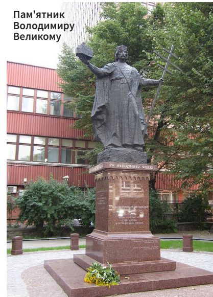
Пам'ятник Володимиру Великому

Пам'ятаючи власну повенну історію, мешканці та влада Гданська надали всебічну допомогу українським біженцям, які прибули до міста після початку повномасштабної