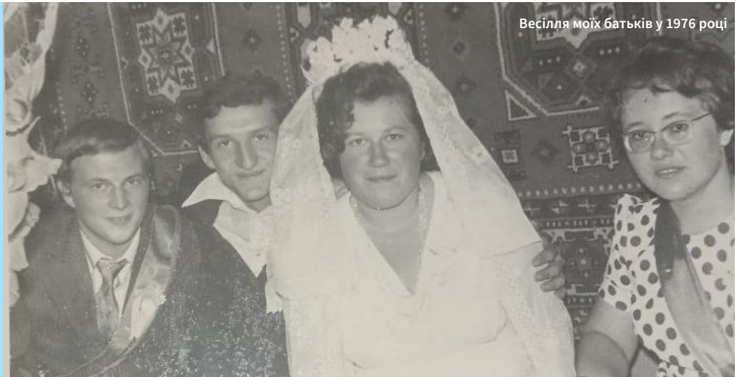
Весілля моїх батьків у 1976 році