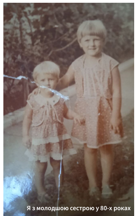
Я з молодшою сестрою у 80-х роках