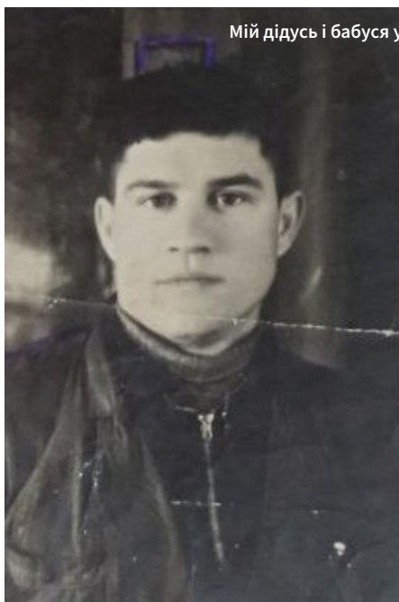
Мій дідусь і бабуся у 50-х роках