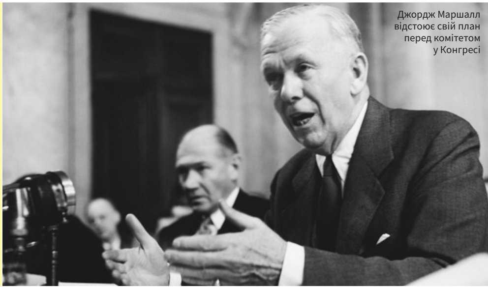
Джордж Маршалл відстоює свій план перед комітетом у Конгресі

5 червня 1947 року державний секретар США й один з найбільш славних генералів Другої світової Джордж Маршалл виступив перед студентами Гарварду з історичною промовою, що започаткувала програму післявоєнної допомоги Європі – European Recovery Program, відому нині під назвою план Маршалла. Ця амбітна програма, яка діяла з 1948 по 1952 роки, стала визначною для відновлення зруйнованого континенту. Вона не тільки забезпечила кошти на відбудову інфраструктури, а й задала вектор інтеграції, що врешті-решт привів до створення Європейського Союзу.