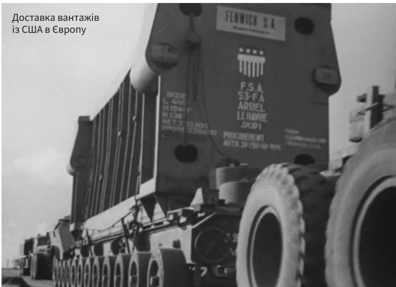
Доставка вантажів із США в Європу

Францією, Західною Німеччиною, Скандинавією, країнами Бенілюкса, а також Туреччиною та Грецією. Нею не скористалися Іспанія (через авторитарний режим Франко) і португальська диктатура Салазара, що, очевидно, стало однією з причин повільнішого післявоєнного розвитку цих країн.