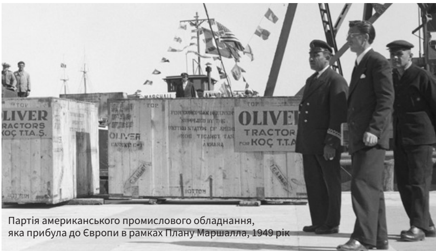
Партія американського промислового обладнання, яка прибула до Європи в рамках Плану Маршалла, 1949 рік