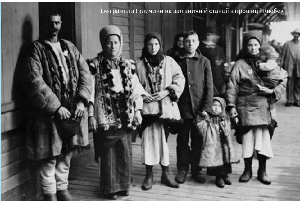
Емігранти з Галичини на залізничній станції в провінції Квебек

Повномасштабна російсько-українська війна спричинила найбільше за кількістю переселення українців за кордон. За оцінками ООН, лише за перші два роки за межі України виїхало понад шість мільйонів людей. Частина з них повертається додому, інші намагаються влаштувати життя на чужині. І хоча нинішній виїзд є драматичним і болісним, явище еміграції українців має глибоке історичне коріння. Умовно історики поділяють еміграцію з України на п'ять хвиль, не враховуючи нинішню. Цей текст відкриває серію публікацій про українську діаспору – чому українці залишали батьківщину в різні періоди, як вони відбудовували своє життя та підтримували зв'язок зі своєю батьківщиною.