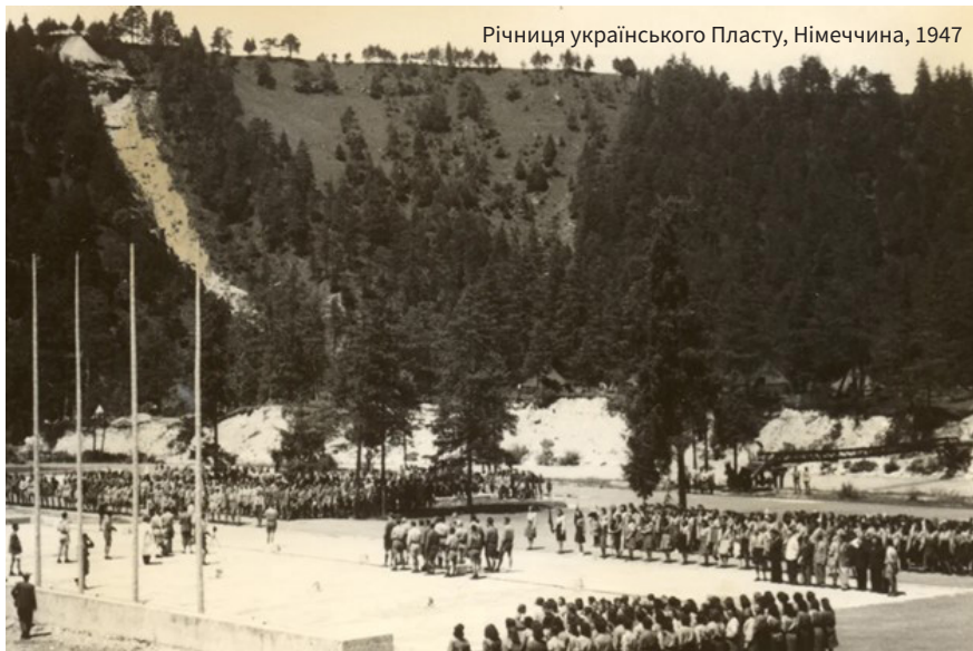
Річниця українського Пласту, Німеччина, 1947

Переміщені особи спершу потрапили у перехідний табір в Австрії, де проходили санітарну обробку: «Наливали