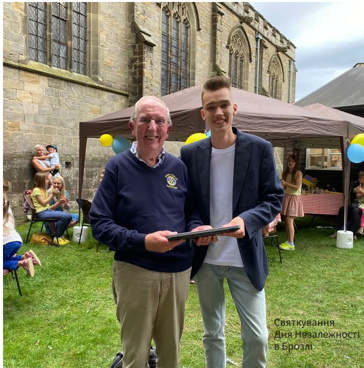
Святкування Дня Незалежності в Брозлі