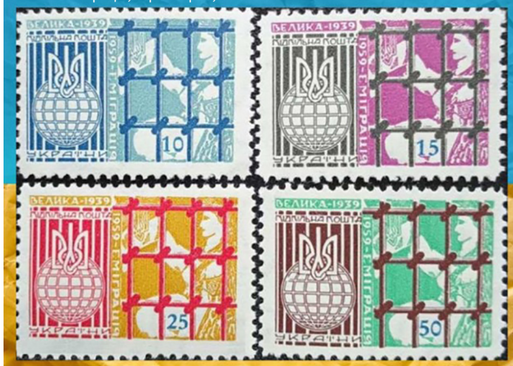
Велика еміграція, серія марок, 1959

нам мазь на голову, це було дуже неприємно, а тоді лікарський контроль... Нам казали роздягнутись, то було таке пониження, що я досі пам'ятаю».