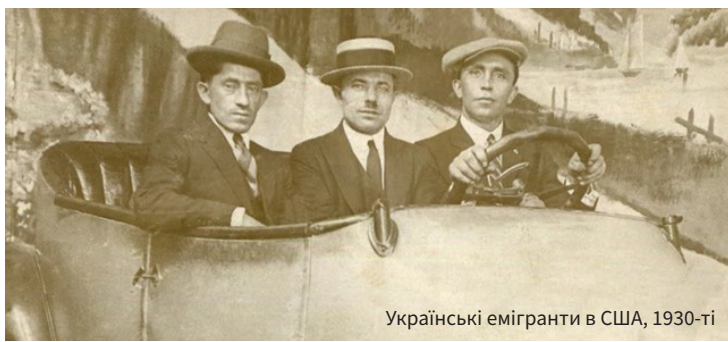
Українські емігранти в США, 1930-ті

зом із Йосипом Сліпим: «Люди самі втікали, бо вже знали, як бути під більшовиками... Тато зорганізував великий поїзд, 50-70 вагонів. Люди мали особові вагони, для нас місця вже не було. Долучили відкритий вагон на самому кінці. Ми з дому багато всього взяли, тато найняв велике авто і мав ще мале. Пізніше поступово це все втрапили. Їхали... поїздом – через Карпати, Чехословаччину, Угорщину, а звідти переїхали кордон до Австрії, і тоді той поїзд зупинився. Їхали понад тиждень».