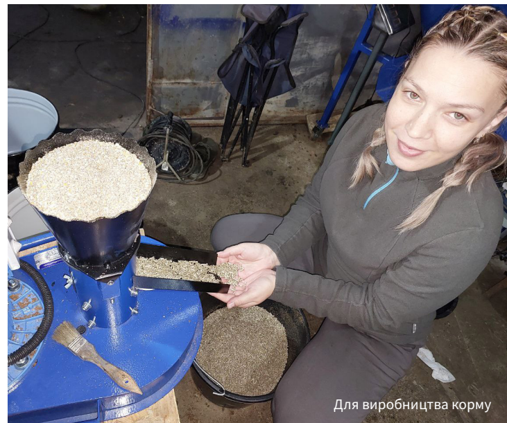
Для виробництва корму

– і справа пішла. Спочатку це були поодинокі продажі знайомим у селі, але дуже швидко інформація поширилася далі.