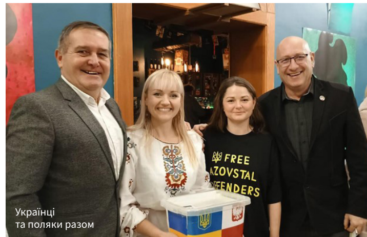
Українці та поляки разом

На жаль, останнім часом значна частина українців воліє менше згадувати про війну. Інтегрувавшись в польське суспільство, люди прагнуть в ньому розчинитися і жити своє найкраще життя. А підлітки перестають брати участь у проукраїнських акціях через тиск з боку польських однолітків. Антиукраїнська хвиля, яку розганяють популістські політики та російські боти у соцмережах, насамперед впливає на молодь. Надивившись Тік-Току, молоді поляки з ентузіазмом