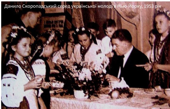
Данило Скоропадський серед української молоді в Нью-Йорку, 1953 рік

у рухах і мові, спокійний, але рішучий, здержливий, поважний, але не зимний, елегантний ззовні і в зносінах з людьми, вільний у поведінці, а при тім повний дійсно гетьманської поваги. Він поривав українців за собою...».