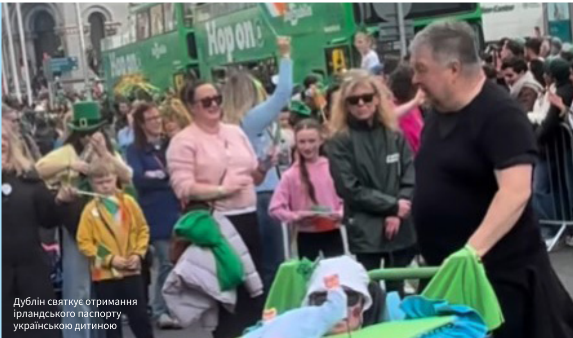
Дублін святкує отримання ірландського паспорту українською дитиною

За різними оцінками, станом на початок 2026 року за межами України залишаються близько 5,5 мільйона українців, які виїхали через війну. Понад 4,3 мільйона з них мають статус тимчасового захисту у країнах ЄС. І навіть у Ірландії, де проживає лише 84 тисячі українців, нещодавно урочисто відсвяткували отримання ірландського паспорту першою дитиною, яка з'явилася на світ у родині українських біженців. А які взагалі правила отримання громадянства для дітей, що народилися поза межами України? І з якими труднощами стикаються батьки, які бажають зберегти за дітьми громадянство України? Про це – в матеріалі «Схід NOW».